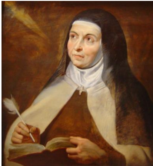
Sainte Thérèse d'Avila, réformatrice du Carmel.

« L'oraison, écrit sainte Thérèse de l'Enfant Jésus, est une chose toute simple. » Ce qui ne veut pas dire que ce soit facile et agréable à la nature. Et si nous profitons des vacances pour commencer... ou continuer nos efforts ?